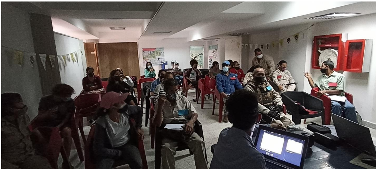
Some attendees on the first day of the workshop / Algunos asistentes el primer día del taller