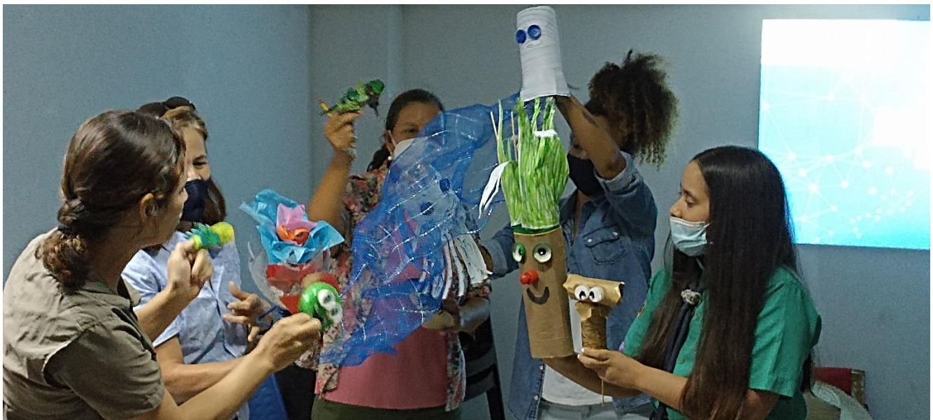
Participants creating characters with recyclable materials and performing the staging of the created story / Participantes creando personajes con materiales reciclables y realizando la puesta en escena de la historia creada