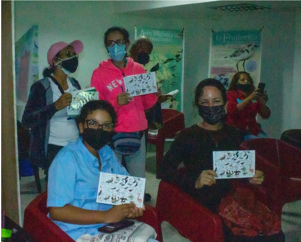
Participants with their ID Card of the birds of the Margarita Island / Participantes con su ID Card de las aves de la Isla de Margarita