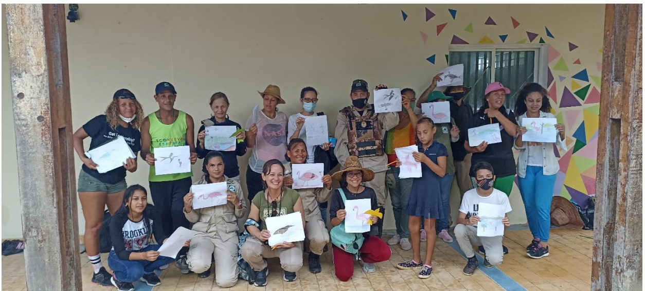
Participants on the third day of the practice in the Laguna de la Restinga National Park / Participantes en tercer día en la práctica de en el Parque Nacional Laguna de la Restinga